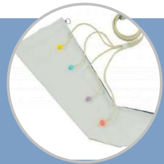
Manga uso individual

Múltiples tamaños disponibles, incluso extra ancho.