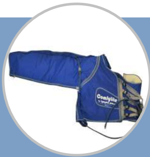
Manga brazo ComefyLife™

Se usa para tratar el linfedema de cáncer de mama en el brazo, el tórax, la axila, el hombro, el abdomen y espalda.