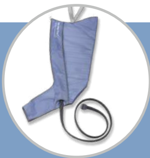
Manga pierna 8 celdas

Ideal para clínicas de heridas, edemas traumáticos, atención hospitalaria y otras necesidades a corto plazo.