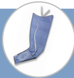
Manga pierna 4 celdas

Se usa para tratar el linfedema de cáncer de mama en el brazo, el tórax, la axila, el hombro, el abdomen y espalda.